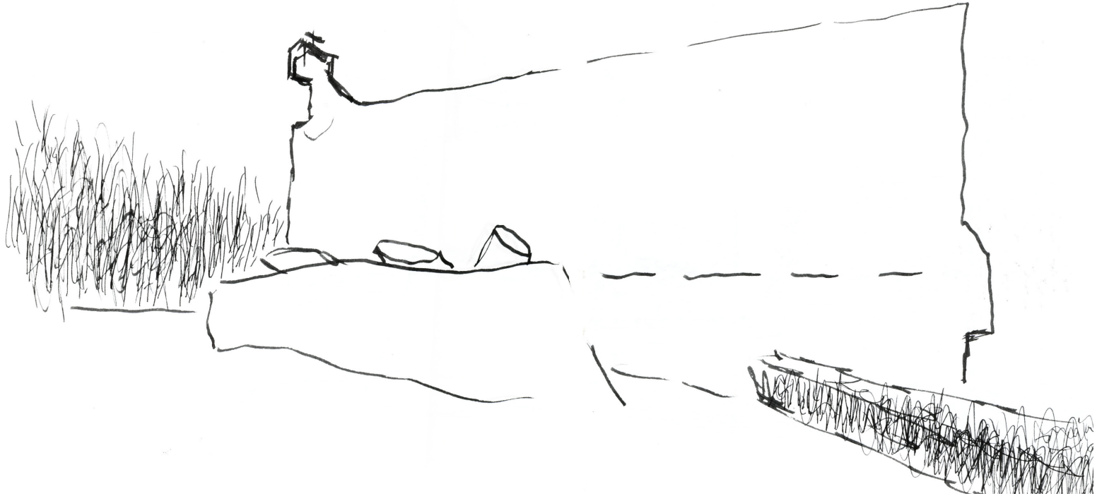
Convento Sainte Marie de La Tourette Le Corbusier – Iannis Xenakis Eveux Sur Arbresle, Lyon, Francia 1957-60

30 de enero de 1996. Aunque no era demasiado tarde la oscuridad y el frío lo abrazaban todo. En el ascenso hacia el convento la niebla era cada vez más espesa, tan espesa como el hormigón con que sabíamos está construido el edificio. Pronto dejamos atrás largas horas de viaje, los campos que cruzamos durante el día, el camino que lleva al convento, para que de a poco fueran apareciendo, diluidas en la niebla, las grandes masas volumétricas del conjunto, enormes sombras que navegaban como buques fantasmas en el silencioso mar que el invierno desplegaba esa tarde. El velo de la niebla promulgaba una primordial verdad del edificio: su flotabilidad, como si desde el cielo hubiera sido edificado, tomando contacto con el terreno en el pórtico elemental de hormigón desprendido del cuerpo del edificio dando la bienvenida frente al desnudo árbol que se alza como último testimonio terrestre antes del abordaje. Sólo una amarilla luz incandescente aportaba una nota de color en este fondo de grises de la tarde, tejiendo la necesaria continuidad entre el día y la noche. La oscuridad nos dejó preparados para el sueño y el reparo. Es necesario cerrar los ojos para volver a ver.