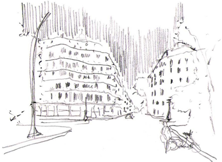
2.- Casa Milà - Barcelona

Enfrentarse a dibujar es por tanto un ejercicio de síntesis. Esta síntesis tiene que ver con el grado de comprensión de lo que debe recoger el dibujo, es por tanto necesario comprender lo que se quiere dibujar. Independiente del resultado final del croquis, lo importante es que se mira , que es lo que vale la pena recoger de lo observado . Es en este minuto cuando conciente o inconcientemente se define el grado de realismo que el dibujo puede llegar a tener. Se podría llegar a hacer un símil con la escritura, en el sentido de llevar una idea o historia a palabras; es por tanto escribir gráficamente, entendiendo el croquis como un texto gráfico , que valga la redundancia, expresa las ideas de lo observado.