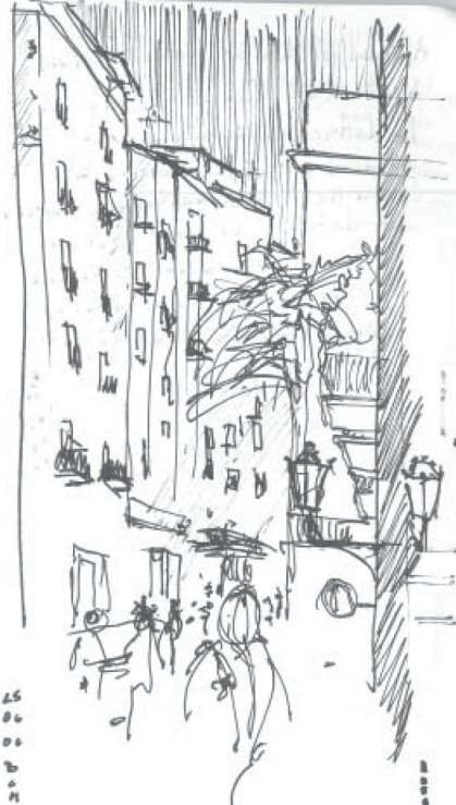
2.- Borne - Barcelona