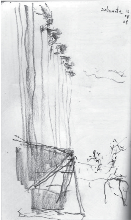
1.- Templo de Selinunte - Sicilia

El dibujo 2 representa una esquina en el paseo del Borne en Barcelona, siendo importantes en la composición del espacio la esquina y los planos detrás de esta y el escorrio de la edificación que delimita la calle. Los peatones, la vegetación, algunos balcones y las luminarias definirán la profundidad del dibujo, abstrayéndose los vanos y balcones de la edificación, llegando a ser manchas en el dibujo que permiten entender la textura de la edificación.