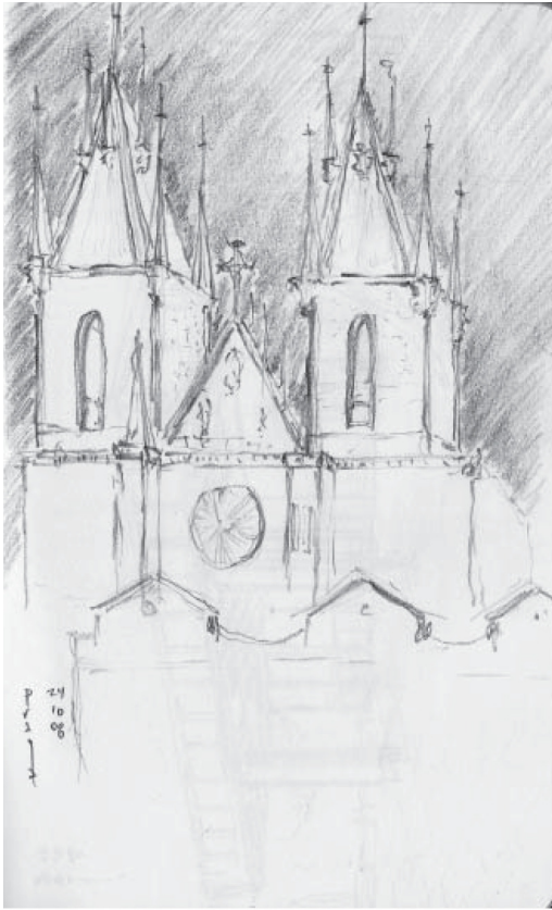
1.- Catedral de Praga Republica Checa