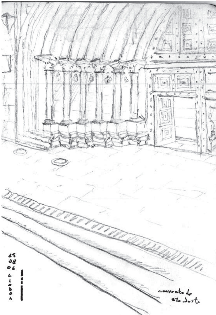
1.- Acceso Convento de Santa Justa - Lisboa

La imagen 2 corresponde a una imagen desde lo alto de las montañas de la playa de Parati en Brasil. Aquí el tema recae en la construcción del territorio, en como un asentamiento urbano asume la geografía donde se ubica, transformándose en parte del paisaje, bajo una trama de damero que se adapta al llegar al mar. La altura de la edificación, homogénea (hecho que se puede ver reflejado en abstracto que resulta ser la composición de los elementos en el dibujo) en casi su totalidad se vuelve neutra con el entorno, que sigue siendo el protagonista del lugar. La vegetación y la cadena montañosa serán el marco contenedor del carácter de este sitio.